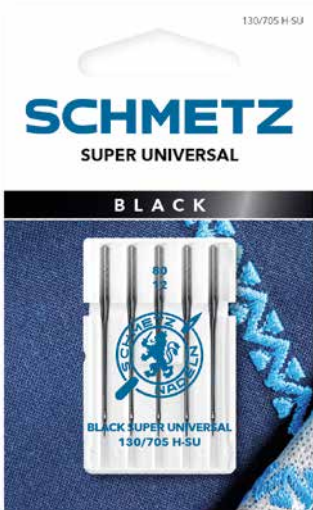
Embalaje de la aguja

Quien utiliza entretela y adhesivo temporal en aerosol o velcro autoadhesivo, en la mayoría de los casos, conoce los desagradables restos de adhesivo en la aguja. Los resultantes saltos de puntadas e hilos rotos son molestos y pueden evitarse.