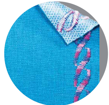
Bordado con entretela adhesiva

Para más información sobre agujas de uso doméstico, visite: